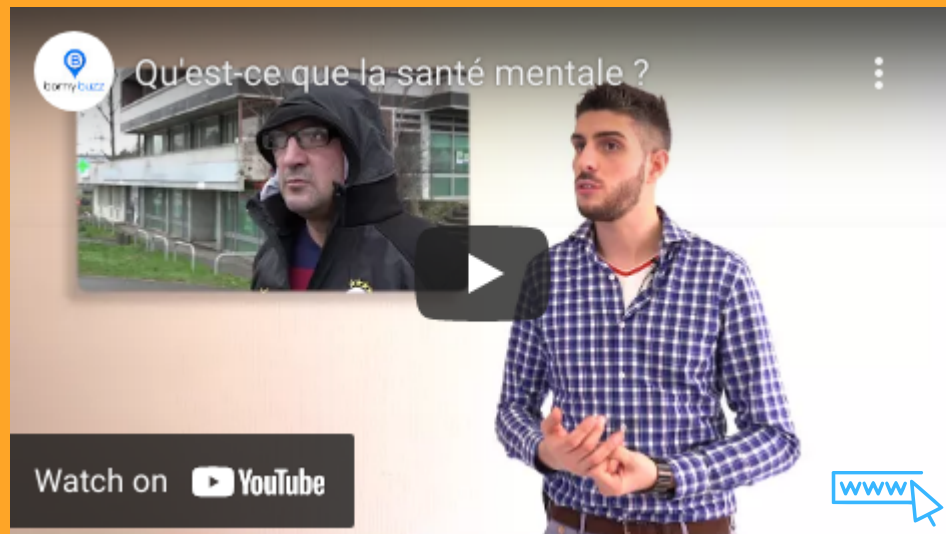
Reportage réalisé par Borny buzz à l'occasion des SISM 2017.

Deux clips pour saisir la notion de "santé mentale" dans toutes ses dimensions