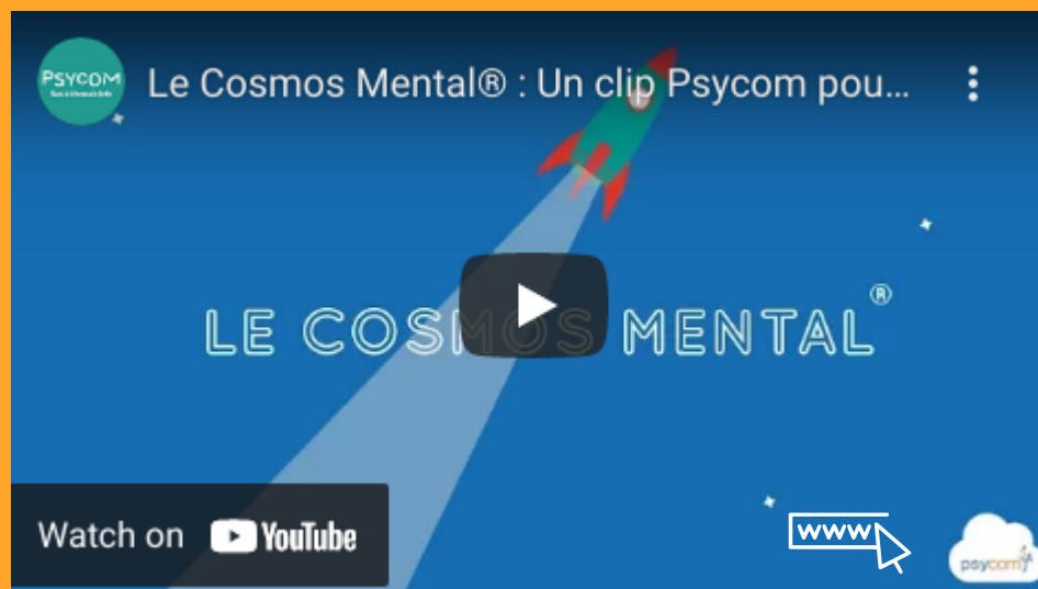
Le Cosmos mental, film d'animation pédagogique réalisé par le Psycom.